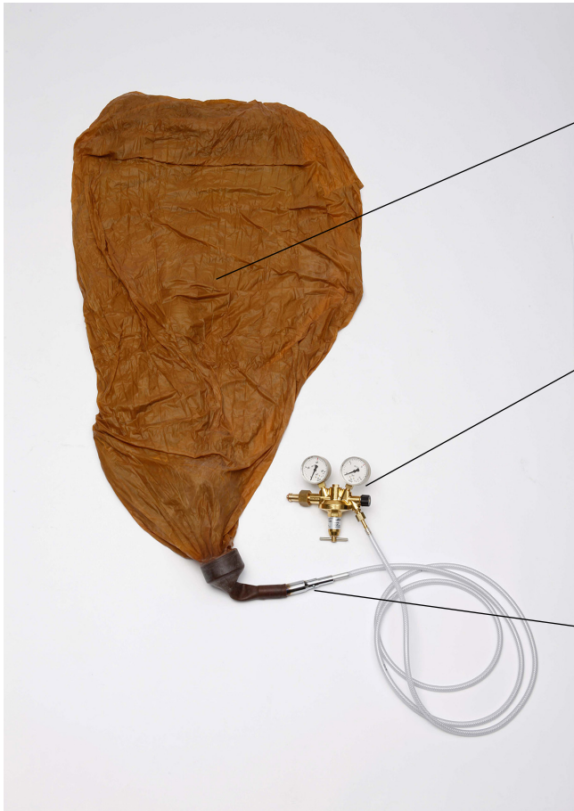
1700 g Wetterballon